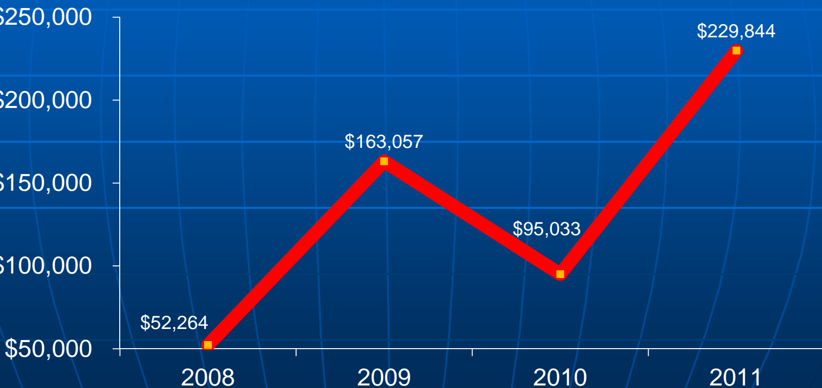
HTS 1515.90.80 Fixed vegetable fats and oils (MFN 3.2%)